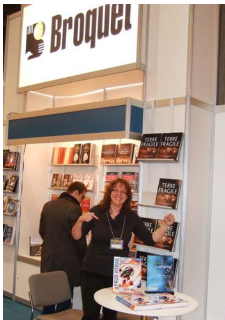
Photo-souvenir de mon 1er passage au Salon du livre de Montréal 2013. J'y serai à nouveau cette année pour le lancement du deuxième tome.

Passez à mon kiosque lors de l'exposition du Salon des arts et loisirs créatifs et courez la chance de gagner un magnifique panier-cadeau contenant plusieurs produits pour faire du faux-vitrail (couleurs et médiums Vitrail, gel, pinceau, livre, dvds, pochoirs, etc.). Chaque billet de participation est au coût de 1$ et tout le monde peut participer (prévoyez de la monnaie!). Bonne chance à tous et merci d'encourager les artistes d'ici!